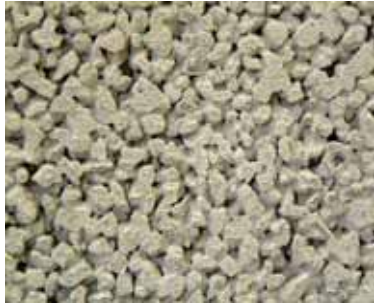
ポーラスコンクリート